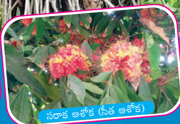
సరాక ఆశోక (సీత ఆశోక)