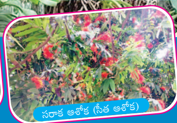
సరాక ఆశోక (సీత ఆశోక)