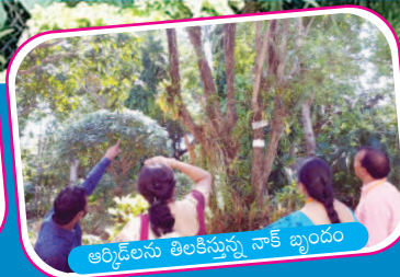
ఆర్కిడ్లను తిలికిస్తున్న నాక్ బృందం