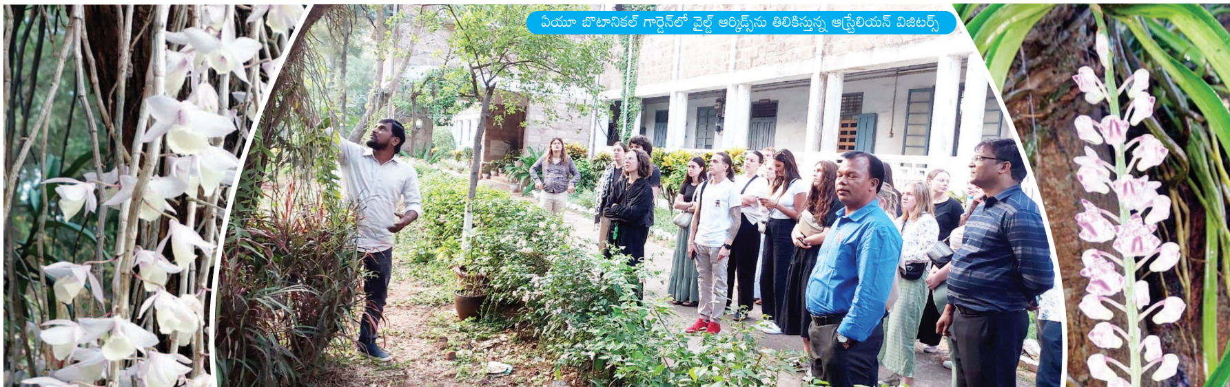
ఏలూరి బొటానికల్ గార్డెన్ లో వైల్డ్ ఆర్కిడ్స్ ను తిలికిస్తున్న ఆస్ట్రేలియన్ విజిటర్స్